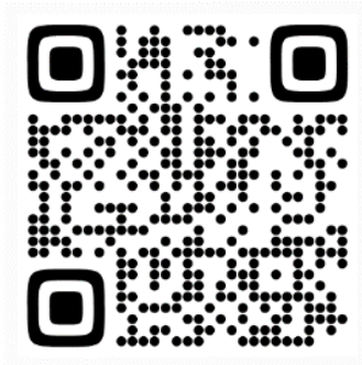
"¡Siempre Habrá Poesía!" Rima IV por Adolfo Bécquer

armonías beso oro enmudeció encendidas vida vista habrá labio podrá perfumes sol poesía aire ojos regazo lleve poetas haber ondas asuntos palpiten luz tesoro agotado siempre falta nubes lira fuego